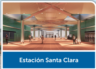
Estación Santa Clara