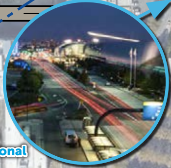
San José International Airport