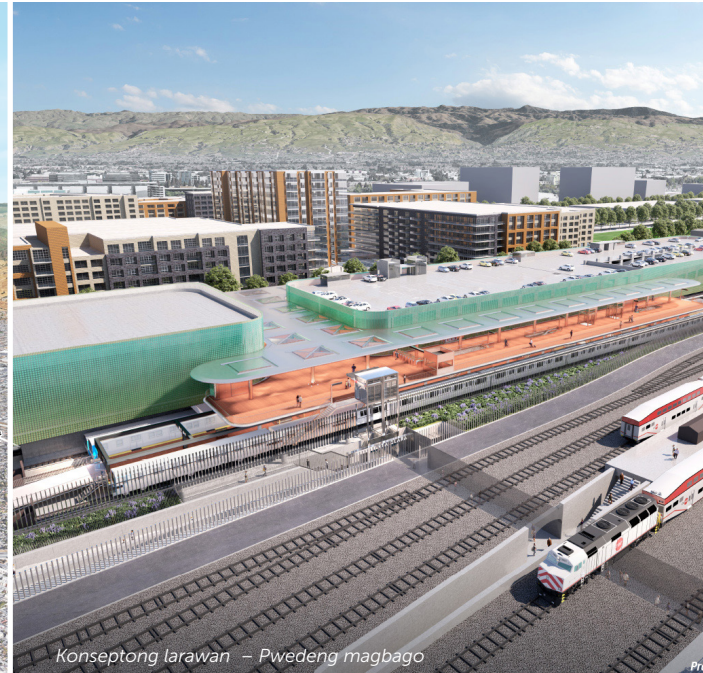
Konseptong larawan – Pwedeng magbago

Ang Istasyon ng Santa Clara, na katabi ng Istasyon ng Caltrain ng Santa Clara at ang paged-develop ng mga Gateway Crossing sa hinaharap, ang magiging dulo ng istasyon ng linya para sa BART Phase II Extension ng VTA. Hindi katulad ng tatlong iba pang istasyon, ang concourse ay mas mataas at ang platform ay nasa kapantayan ng lupa, katulad ng istasyon ng Warm Springs BART. Ang istasyon ay magkakaroon ng paradahan ng sasakyan, mga pasilidad para sa bisikleta, at pag-uugnay patungo sa Caltrain, Capitol Corridor, Altamont Corridor Express, at ilang linya ng bus ng VTA sa kasalukuyang ilalim na tawiran na pedestriyan ng Santa Clara.