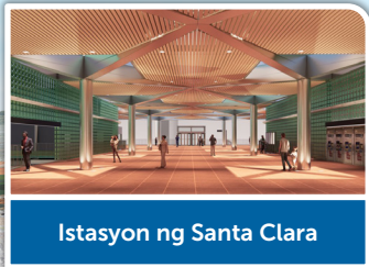
Istasyon ng Santa Clara