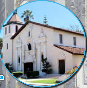
Santa Clara University