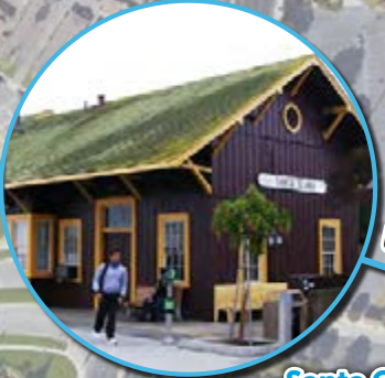
Santa Clara Caltrain Station